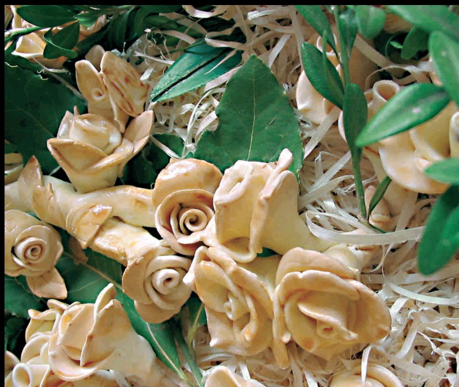
Pani di San Giuseppe - Panes de San José