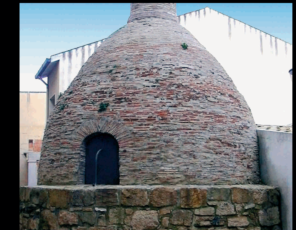
Fornace Sant'Angelo - Horno san Ángelo

Extra circuito-Circuito esterno: Agro salemitano Salemi agro La natura gessosa dei suoli da sempre ha favorito la coltivazione di lussureggianti vigneti Salemi, agro La naturaleza yesosa de los suelos desde siempre ha favorecido el cultivo de excepcionales viñedos