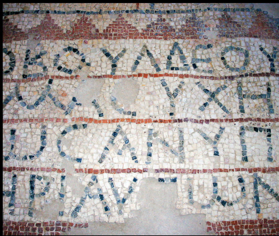
Basilica di San Miceli, pavimento musivo - Basilica de San Miceli, pavimentación musivaría