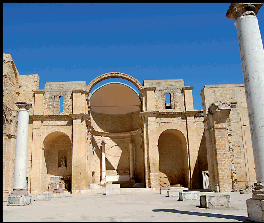
Ex Chiesa Madre - Ex Iglesia Madre